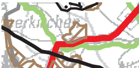
Abbildung 1: Ausschnitt LROP 2017

Das Landes-Raumordnungsprogramm Niedersachsen (Änderung der Verordnung über das Landes-Raumordnungsprogramm Niedersachsen (LROP-VO) mit Rechtskraft vom 17. Februar 2017, zuletzt geändert am 07.09.2022) enthält keine plangebietsbezogenen Aussagen. Südlich des Ortsteils Großenmeer wird die Bundesstraße B 211 als Vorranggebiet Hauptverkehrsstraße dargestellt. Östlich von Großenmeer wird zudem ein Vorranggebiet Torferhaltung dargestellt. Südwestlich des Ortsteils verläuft zudem ein Vorranggebiet Biotopverbund (linienförmig).